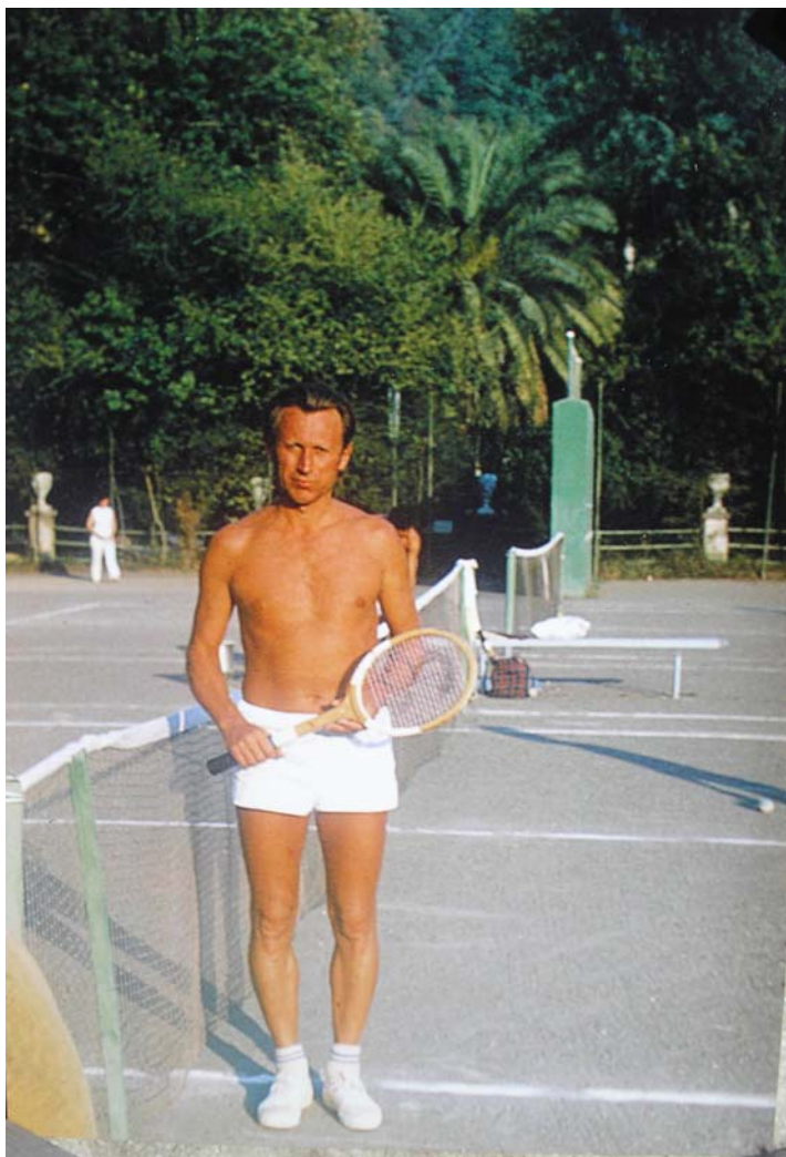
На теннисных кортах